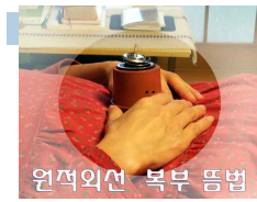
원적외선 복부 뜸법

ETG-자석침 KM 5-NS보사세트 엄지태양 지압기 광명뜸(수지뜸용) 각대(밴드테라피)